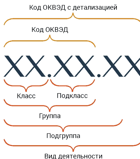
Рис. 1 – Код ОКВЭД с детализацией

XX. XX. XX. — вид XX. XX. X. — подгруппа XX. XX. — группа XX. X. — подкласс XX — класс